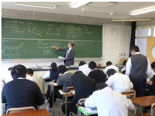
金子教諭（数学）による外積の説明